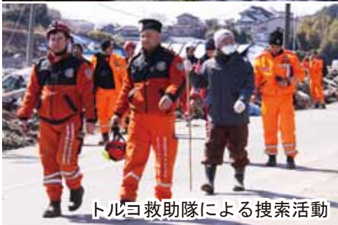
トルコ救助隊による捜索活動