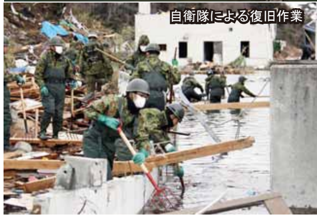
自衛隊による復旧作業