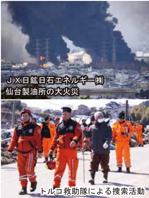
JX日鉱日石エネルギー(株) 仙台製油所の大火災