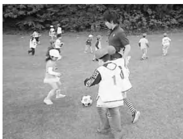
コバルトレ女川によるサッカースクール