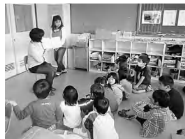
お日さまの会による読み聞かせ