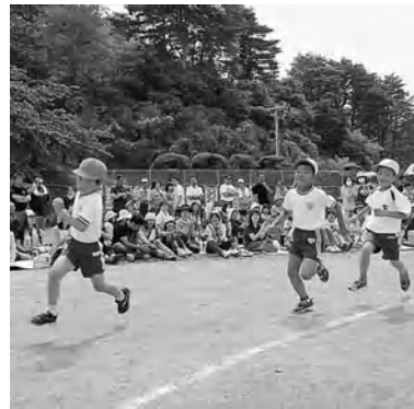
小学校合同運動会

6月12日女川一小・二小・四小の合 同運動会が開催され、子どもたちは家 族の支援を受け、徒競走や綱引きなど の競技を精一杯行いました。また、全 児童参加のフオークダンス「マイムマ イム」は壮大でした。 当日の運動会の様子は、おながわさ いがいFMで生放送されました。