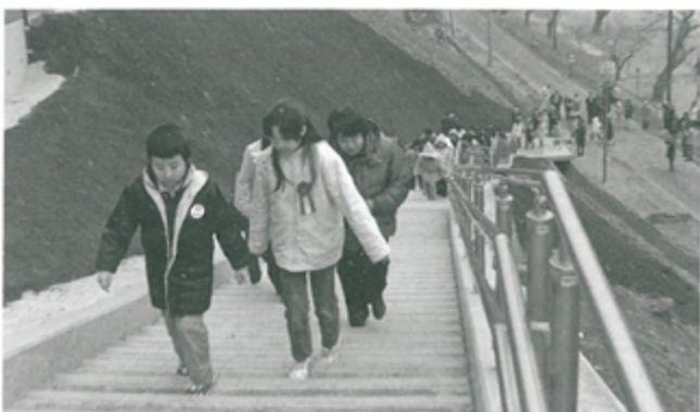
2年前に完成した避難階段

の寒波に見舞われ、津波で甚大な被害を受けた小本地区は厳しく冷え込み、被災者は毛布にくるまって寒さをこらえました。停電が続く避難所では燃料消費を抑えるため日中の発電機使用を中断。石油ストーブの使用も必要最小限にしなければなりません。被災現場では、雪に覆われたがれきの中のガラスや釘を踏むけが人が相次ぎ、作業の効率を悪化させました。