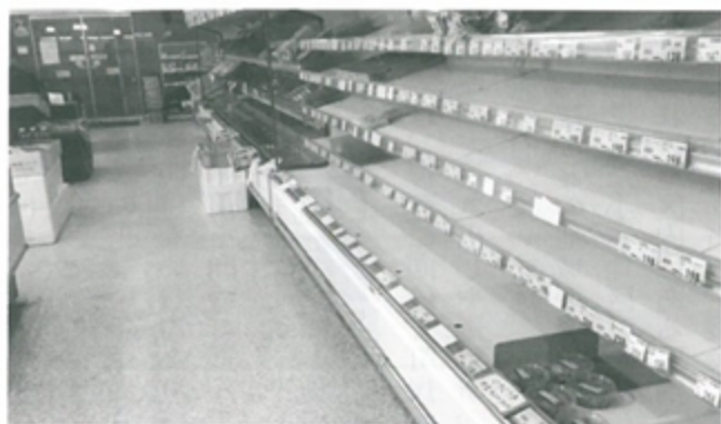
商品不足のスーパーマーケット

や金額を制限して販売しました。灯油は病院や浄水場、ゴミ焼却場を優先。町は各避難所にも可能な範囲でストーブ用の灯油を供給しました。