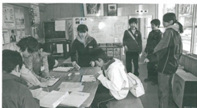
町民ルームに設置されたボランティアセンター