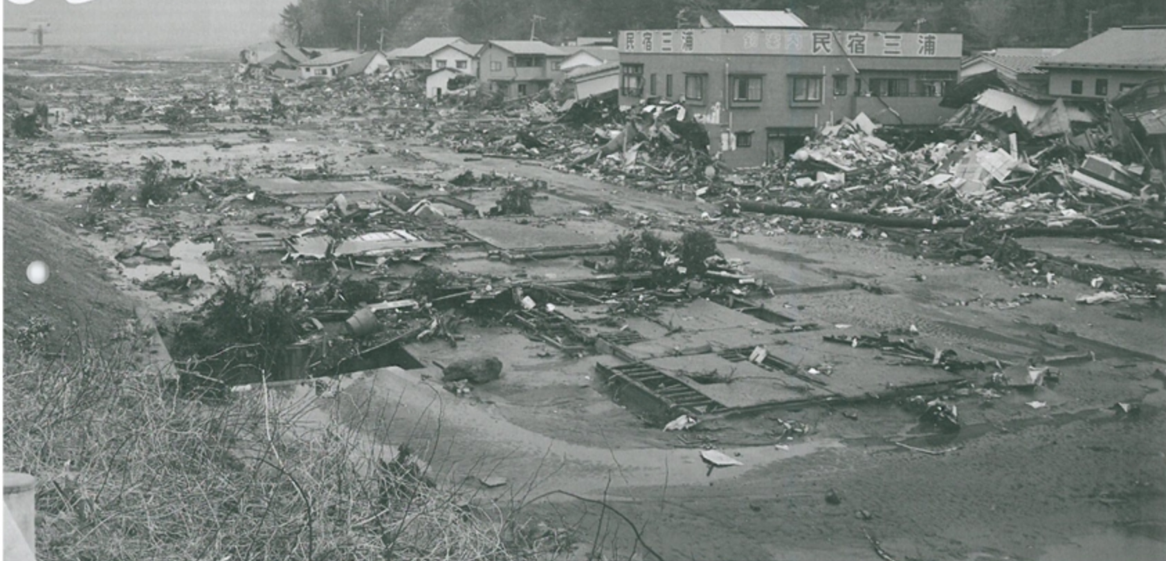
被災した小本地区

東日本大震災は、本町はもちろん東北関東の広い範囲に甚大な被害をもたらしました。町の被災現場には深い悲しみの涙、救援の汗が交錯していました。ここでは情報が絶たれた被災現場で何が起ったのか、そして、これからどうすればいいのかをお伝えします。