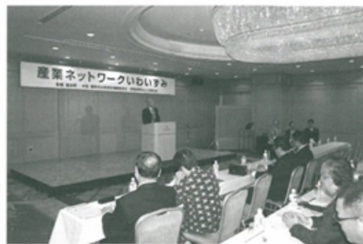
東京都内で開催した「産業ネットワークいわずみ」

中小企業の経営基盤強化のために資金融資枠の確保に努め、労働者の社会保障制度への安定加入のための支援策を講じます。