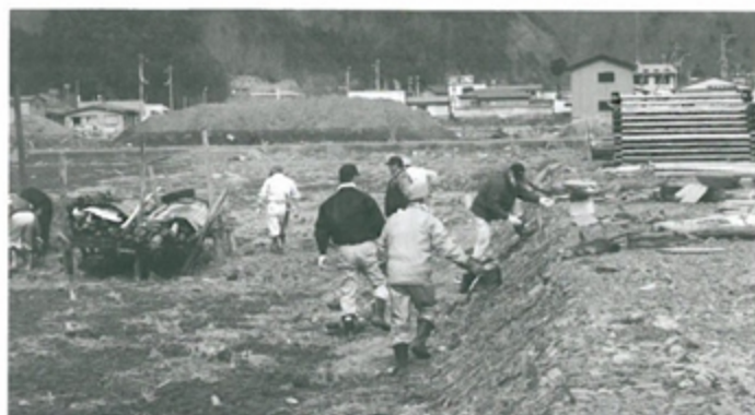
瓦礫の撤去作業にあたる町議会議員