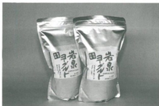
岩泉乳業のヨーグルト

安全安心な農産物の生産を基に、本物の農畜産物の付加価値と収益性を高め、他との差別化を明確にし、産地間競争力の強化が必要です。オンリーワン