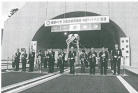
開通した中野バイパス

も、国道の整備促進を関係機関に強く要望していきます。町道なども順次整備を進め、「すぐやる道路維持補修事業」などで、目の行き届いた維持修繕に努め、「生活道及び農道整備事業」の補助率を3分の2から90%に拡充するなど、生活に密着した道路の維持管理に努めます。