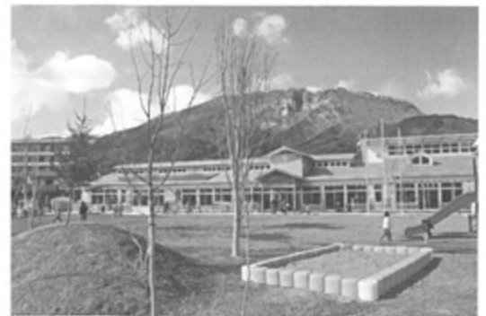
完成した「いわいずみこども園」

まちづくりの基本は人材の育成であり、町民が生きがいのある人生を送り、地域社会を支え