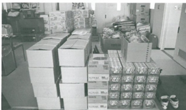
町に届けられた救援物資