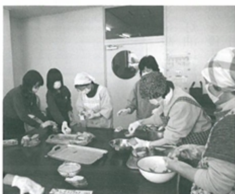
昼食の準備を急ぐ炊き出しボランティア

町内の婦人会や企業、個人でも物資の寄付やボランティア参加が見られ、復興に向けた機運が高ま