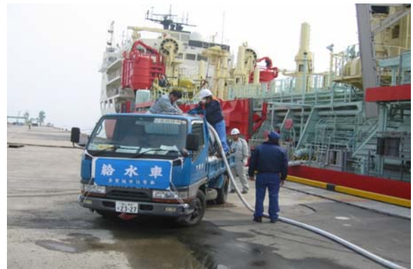
3月20日 海翔丸から給水車へ飲料水提供の風景